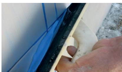
Aplicação do ADHERE Cor