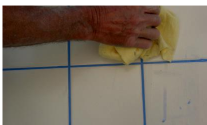
Limpeza do excesso de argamassa