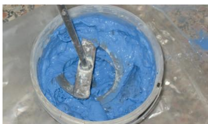
Amassadura do ADHERE Cor