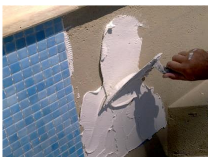
Espalhamento do ADHERE Piscinas sobre o suporte