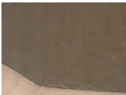
Preparação do suporte