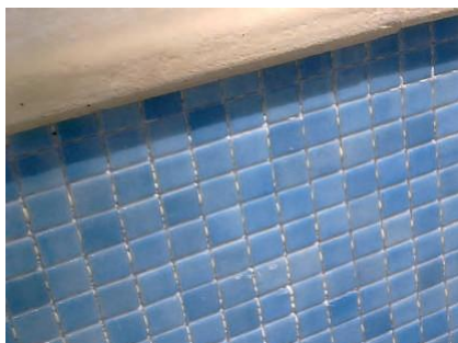
Colocação da pastinha de vidro

Para colagens mais exigentes em paredes, recomenda-se a utilização de reboco MAXDUR e em pavimentos recomenda-se a execução da camada de enchimento com BETONILHA de Alta Resistência .