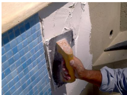
Regularização com talocha denteada