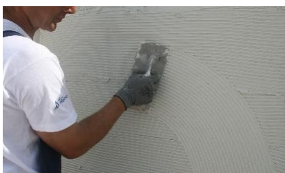
Regularização com talocha denteada