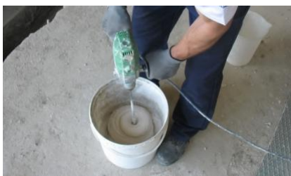
Mistura de ADHERE Clássico