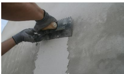
Espalhamento de ADHERE Clássico