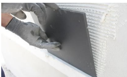
Colocação de cerâmico