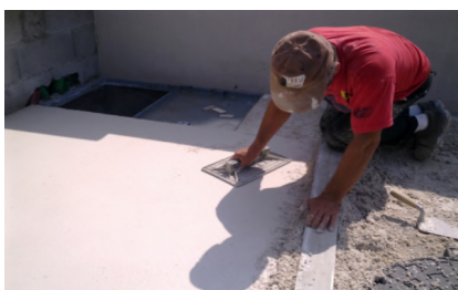
Talochamento da superfície