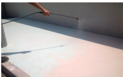
Aplicação do desactivante de superfície SecilTEK AD 32 para o acabamento natura

A percentagem de incorporação do agregado deve ser requerida ao Serviço Técnico da Secil Argamassas, mediante a disponibilização de amostras físicas.