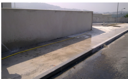
Preparação do suporte