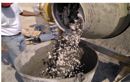
Amassadura da MY SCALA com adição de agregado