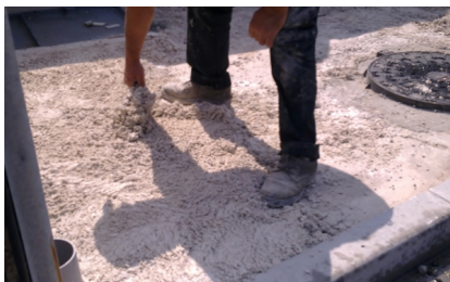
Colocação da argamassada