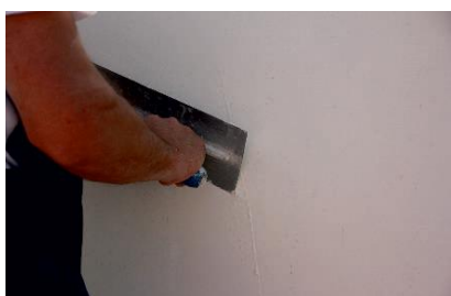
Obtenção do acabamento liso