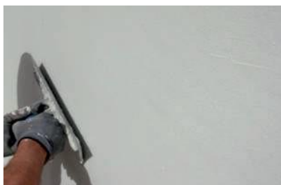
Aplicação do primeiro barramento